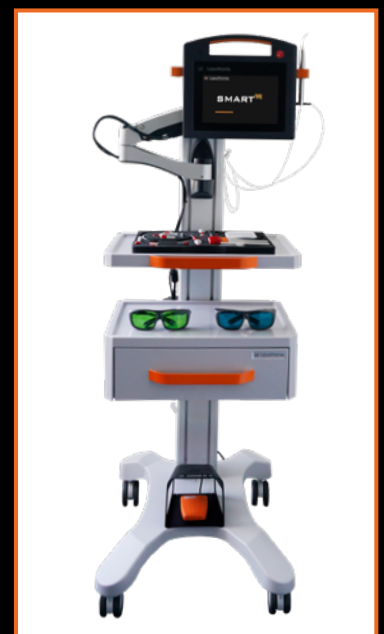
ERGONOMICZNA STACJA ROBOCZA