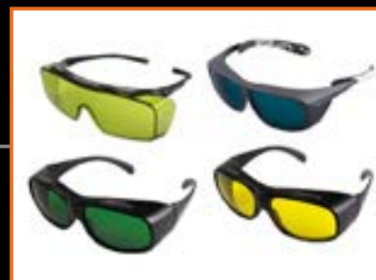
BEZPIECZNY DLA LEKARZA I PACJENTA