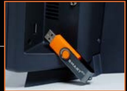
BAZA DANYCH, INSTRUKCJA I KLUCZ W JEDNYM