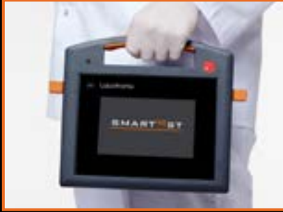
FUNKCJONALNOŚĆ I WYGODA