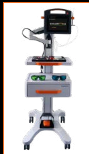
ERGONOMICZNA STACJA ROBOCZA