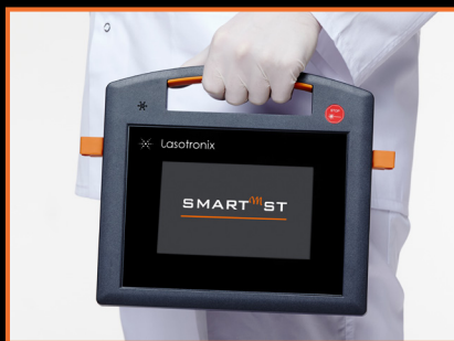
FUNKCJONALNOŚĆ I WYGODA