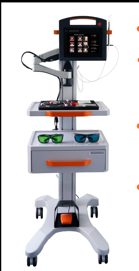
ERGONOMICZNE STANOWISKO ROBOCZE