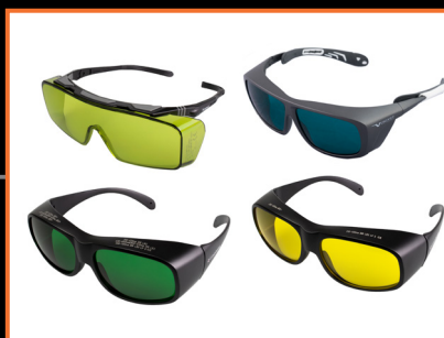
BEZPIECZNY DLA LEKARZA I PACJENTA