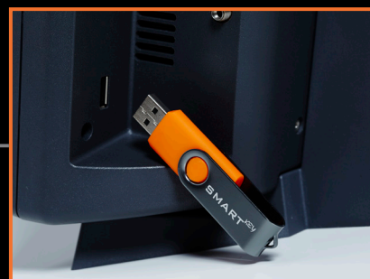
BAZA DANYCH, INSTRUKCJA I KLUCZ W JEDNYM